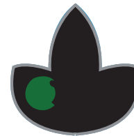
Sala del CRETÁCICU