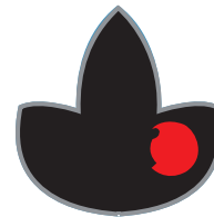
Sala del TRIÁSICU