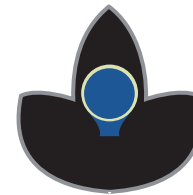
Sala del XURÁSICU